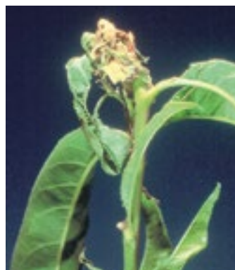
Anarsia. Daños en brote