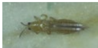
Adulto de Frankliniella occidentalis

Para mantener una alta eficacia en control de trips, no realice más de tres aplicaciones con la misma materia activa por ciclo de cultivo, y procure alternar productos con diferente mecanismo de resistencia.