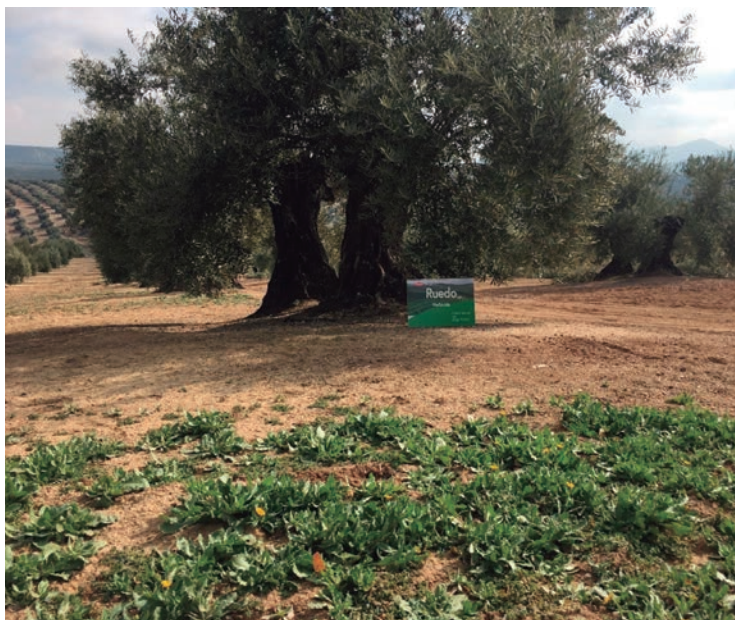
Eficacia de Ruedo ® 4 meses después de la aplicación.