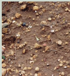
Malas hierbas en punto verde

Para obtener la mejor eficacia, aplicar Ruedo® con el terreno en tempero o cuando se esperen lluvias tras la aplicación.