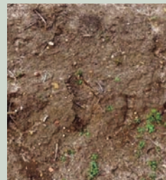
Malas hierbas en dos hojas